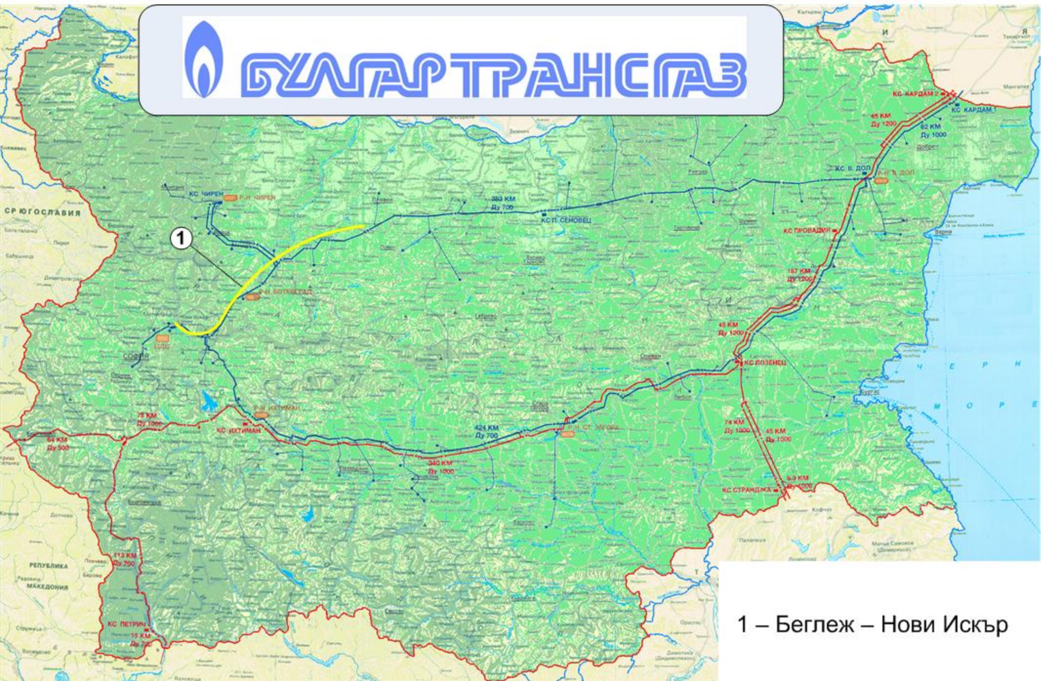
1 – Беглеж – Нови Искър